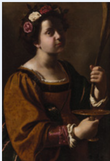
Naomh Laoiseach le Artemisia Gentileschi (c. 1642-4)

daoine ar fud an domhain cuimhneamh ar Naomh Laoiseach fós. Siombail de sholas Chríost, i dtréimhse na heagla agus an dorchadais, atá inti. Éarlaimh na súl, foinse solais an choirp, atá inti freisin. Is minic a iarrann daoine le fadhbanna súl cabhair ar Naomh Laoiseach.