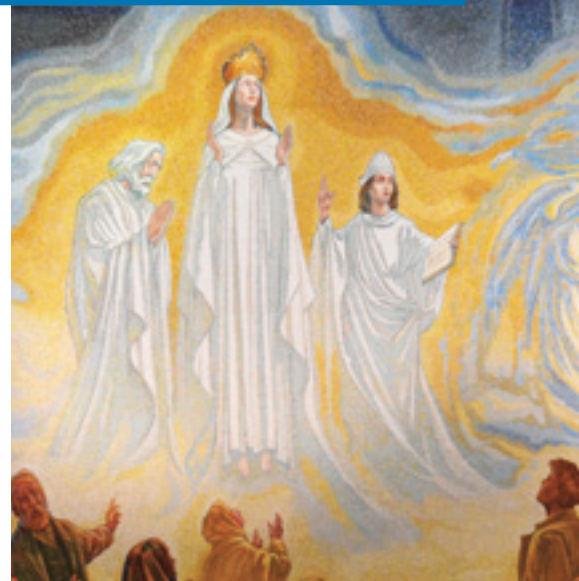
A Mhuire Chnoc Mhuire, guigh orainn