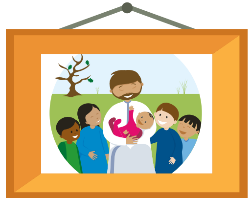
Íosa, ár gcara