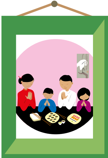
An bia a ithimid

Scríobh faoi na rudaí a bhfuil tú buíoch astu agus tarraing pictiúir.